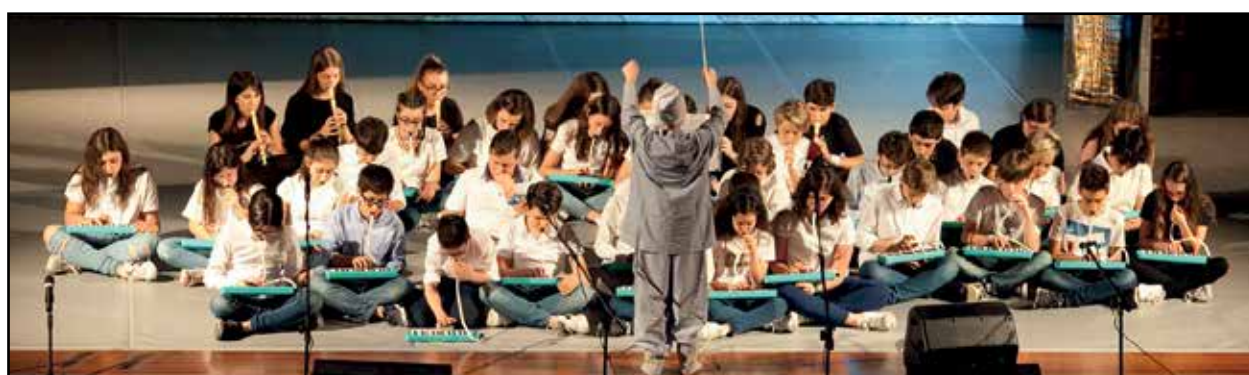
La prova musicale in un passaggio del saggio.

E così, uno dopo l'altro, hanno fatto il loro ingresso in scena alcuni dei grandi personaggi della nostra storia: da Leonardo da Vinci a Giacomo Leopardi, da William Shakespeare ad Antonio Vivaldi, da Dante Alighieri a Galileo Galilei, da Guglielmo Marconi a Botticelli, dai Beatles a Coco Chanel. A fare da filo conduttore il diabolico piano, messo in atto da un esilarante