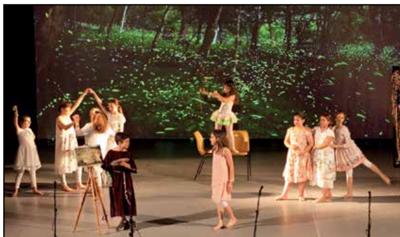
Una scena della rappresentazione.

conclusione del macro-progetto d'Istituto "m'inGENIO", dedicato quest'anno al tema dell'arte e della scienza attorno alla figura di Leonardo da Vinci e segna un'ulteriore ed importante tappa nel percorso di Scuola cattolica, ispirata all'eccellenza ed aperta all'internazionalizzazione su cui l'Istituto di Borgosotto è da tempo impegnato.