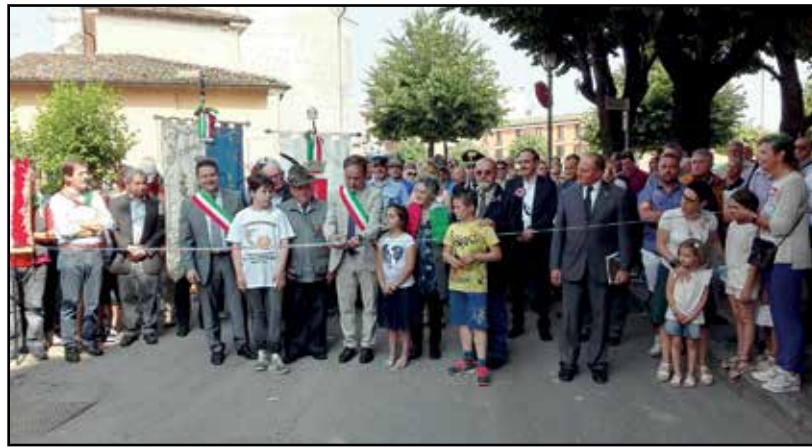
Il momento del taglio del nastro.

Il corteo dei partecipanti ha quindi percorso via Paolo VI nel tratto che, come deliberato dal-