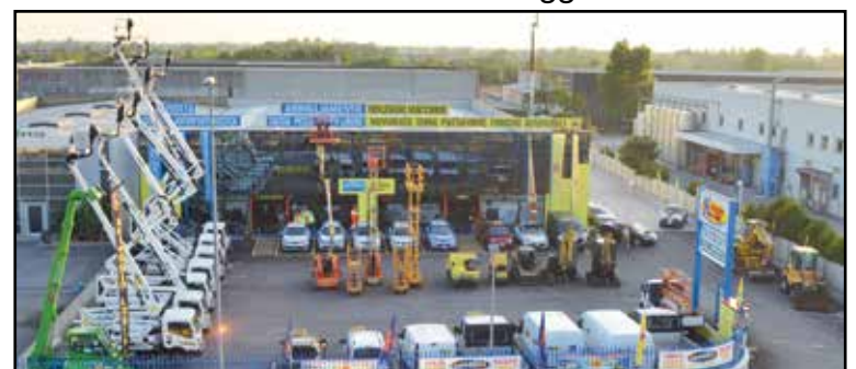
La nuova sede della Noleggio Lorini in zona industriale, via E. Montale 15.

SEDE: MONTICHIARI (BS) - Via E. Montale, 15 FILIALI: CALCINATO - CASTEGNATO tel. 030.9650556 - www.noleggiolorini.com