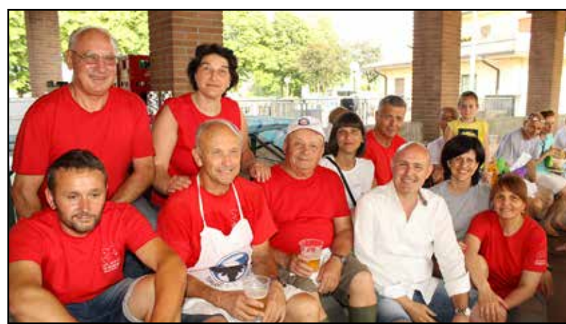
Un gruppo di volontari con i vertici dell'Associazione.

Molto importante è poi risultato il ritrovarsi delle famiglie, la condivisione dei problemi, un momento di socializzazione ed integrazione per superare certe diffidenze, uno scambio alla pari delle varie problematiche. Le famiglie dei ragazzi, con vari tipi di disabilità, hanno trovato nell'As-