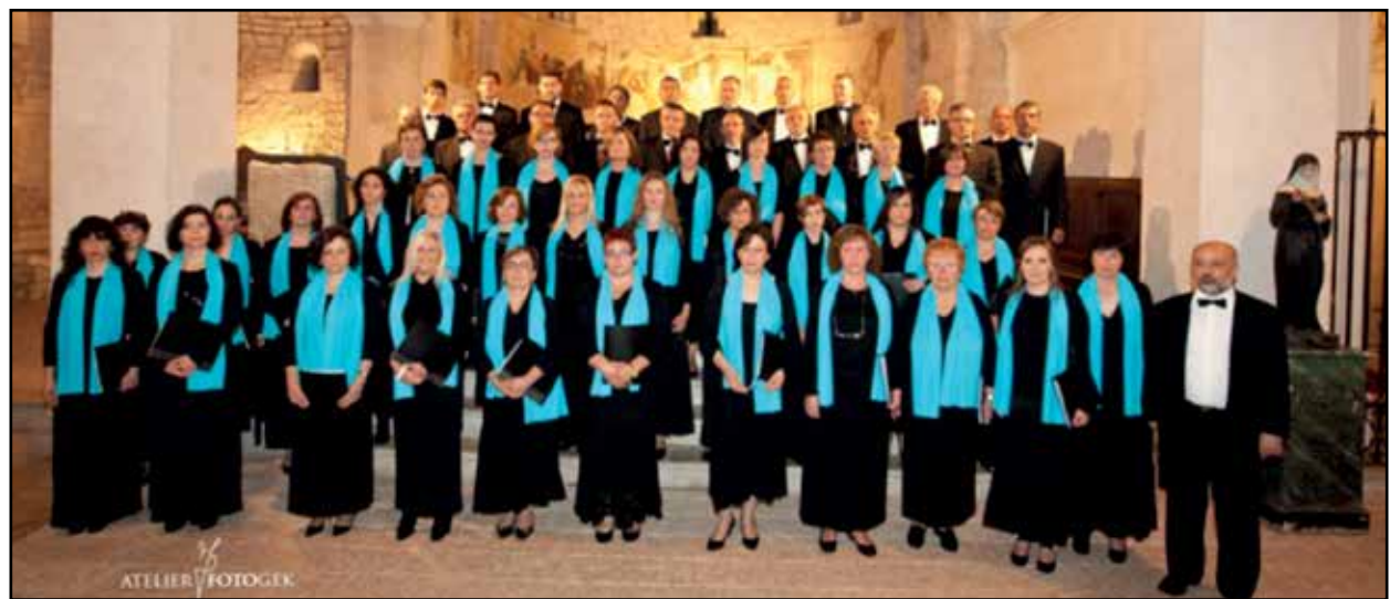
Il Coro S. Pancrazio all'interno della Pieve di San Pancrazio.