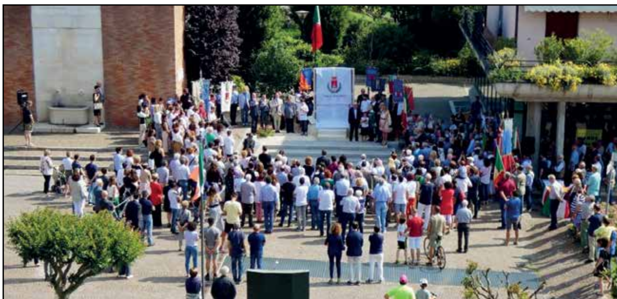
Una suggestiva visione dall'alto della cerimonia.